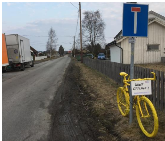
THE BIKES oppfordrer til «Keep cycling!» i tre «blindveier» med manglende skilting som her i Riisalleen på Skedsmokorset!

Lokallagsnytt | Lillestrøm og omegn | Trafikk og politikk 12. april 2019 | Carsten Wiecek