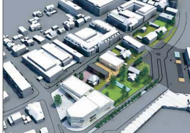
POLITIKERNES VILJE: Det politiske flertallet med Ap i spissen vil i langt større grad bygge ned parken som ble vedtatt i 2004. RB: Jan. 2012 ILLUSTRASJON: SKEDSMO KOMMUNE