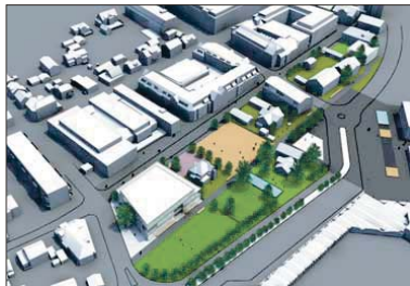
FOLKETS RØST: Slik mener by- og bygdelistas Kulturkvartalet ved stasjonsområdet bør bli. Mediehus på «Hotelltomta», men ellers park. ILLUSTRASJON: SKEDSMO KOMMUNE