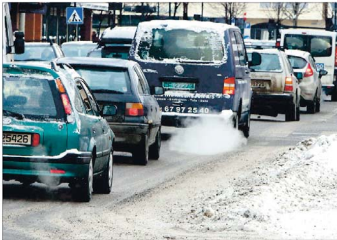
PÅ FLERE FELT: Folkets Røst ser klare voksesmerter i utviklingen av Skedsmo, innen skolesektoren, eldreomsorgen og særlig trafikkavviklingen.

Det er tverrpolitisk enighet om å styrke hjemmetjenesten så de