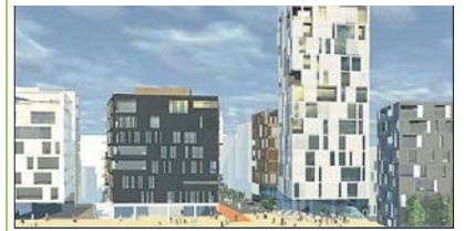
KREVENDE: Man må være veldig forsiktig ved grensen mellom Hagebyen og høyhusdelen.