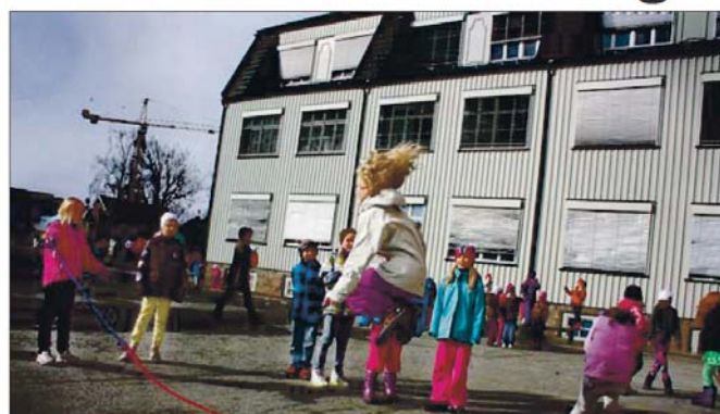
INDIVIDUELL UTVIKLING: Skolens kvalitet er mer enn tall i en statistikk. Bildet er fra Sagdalen skole.

Det er urimelig å bedømme skoler bare på karakterer og resultater på prøver