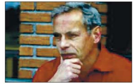
MÆLAND: Sovet i timen?

Innen 30. juni 2015 skal vi sørge for 100 nye sykehjemsplasser gjennom å bygge på og utvide kapasiteten på Lillestrøm bo- og behandlingssenter (Libos) med 66 plasser, samtidig som vi får på plass 34 heldøgnsbetjente omsorgsboliger i tilknytning til Skedsmotun. Skedsmo Arbeiderparti vil også styrke demensomsorgen ytterligere og sørge for at Skedsmo blir en foregangskommune innen demensomsorg. Vi vil videreføre «pårørende skole» og styrke veiledning og etterutdanning for de ansatte med et eget demensteam. Vi vil også sørge for at kommunen ikke må kjøpe sykehjemsplasser utenfor kommunen.