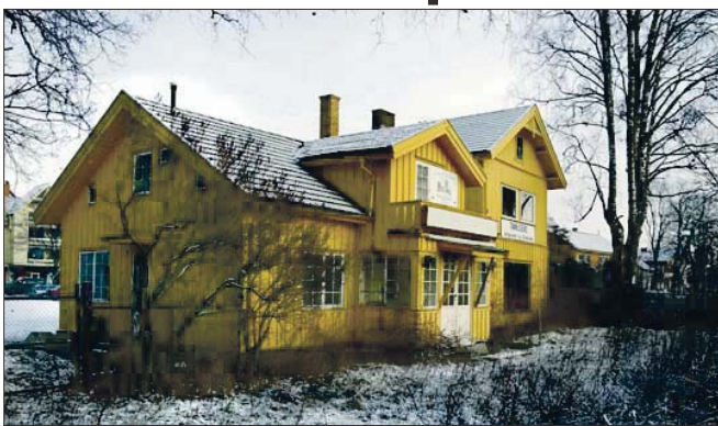
«VERNET»: De politiske partiene, bortsett fra Folkets Røst, overser at de tidligere har lovet park uten nybygg ved det gule huset i Kirkegata 10, skriver innsenderne.

Alle partiene lovet i 2004 at det skulle bli park uten nybygg i Kirkegata 10 i Lillestrøm. På eiendommen står et gult hus hvor familien til vår kjente kunstner Henrik Sørensen har bodd. Mange innbyggere ønsket en statue av Sørensen på denne sentrale eiendommen hvor det var planlagt park og hvor det er mest sol. Nå legger kommunen opp til et nybygg her som skal leies ut til Akershus kunstsenter. Det som blir igjen av areal til park i Kirkegata 10 og 12 er på størrelse med en middels hage.