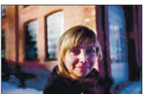
KOMISSAR: Akershus kunstsenter.