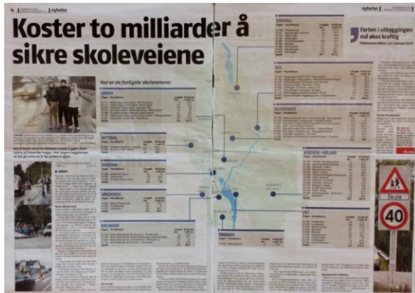
Skal det virkelig ta "65 år før skoleveiene er trygge" på Romerike? (kilde: Romerikes blad av 19.11.12)