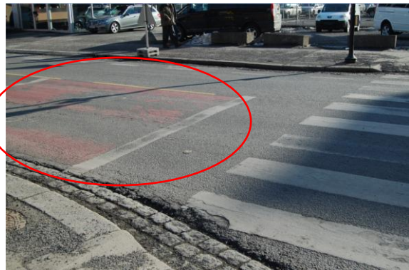
Rødmalte sykkelfelt og -boks i kommunens presentasjoner/plandokumenter og i den virkelige verden... (a) er figur 8 fra hovedplanen, (b) viser samme sted mars 2012 (c-e) fra rapporten Vintersyklist søkes , side 11)